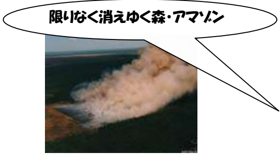
燃えるジャングル

アマゾンの森は地球の酸素の約4分の1を供給し、地球環境のバランスを維持しています。しかしながら森は、今も毎年広島県の約3倍もの面積が私たち先進国の便利で豊かな生活の影で消失しています。このままでは、あと数十年でアマゾンの森は無くなってしまいかもかもしれません。 先住民インディオは伝えます。「森がなくなればインディオは死ぬ。しかしお前たちの世界も滅びることを忘れてはならない」と・・・ アマゾンの森を守るために、未来を守るために 何を考え、どう行動しなければならないのか！ 現地状況を聞き、合宿をしながらさまざまなワークとおして考える3日間です。